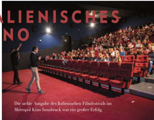
Die siebte Ausgabe des Italienischen Filmfestivals im Metropol Kino Innsbruck war ein großer Erfolg.

Am Sonntag, dem 12. November eröffnete das Istituto Dante Alighieri Innsbruck die siebte Ausgabe des italienischen Filmfestivals im Metropol Kino mit der Vorführung des Films „Coro da 12“. Die Eröffnung war ein großer Erfolg: Der Kinosaal war voll und das Publikum war begeistert, den Zauber des italienischen Kinos in Innsbruck erleben zu dürfen.