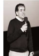
Präsident Piero Salturi war begeistert von den zahlreichen Besucher:innen.